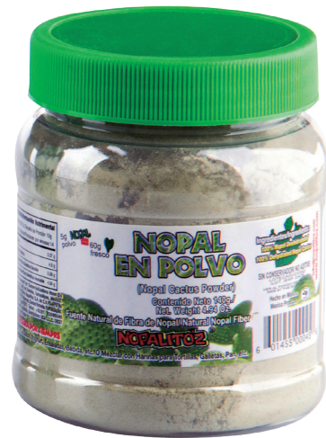
NOPAL EN POLVO 140g